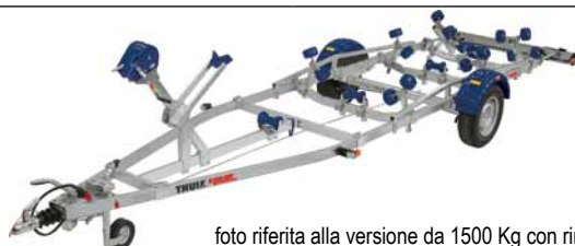
foto riferita alla versione da 1500 Kg con rinforzo longherone