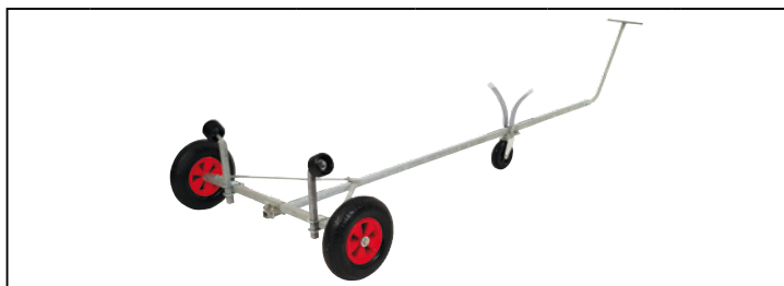
LBN 112 HTR - HTK